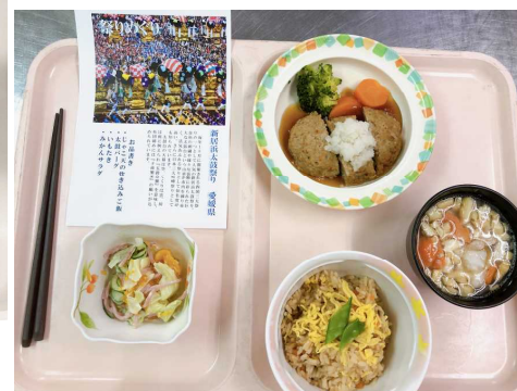
新居浜太鼓祭り 愛媛県