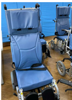
リクライニング型の車椅子（5台）