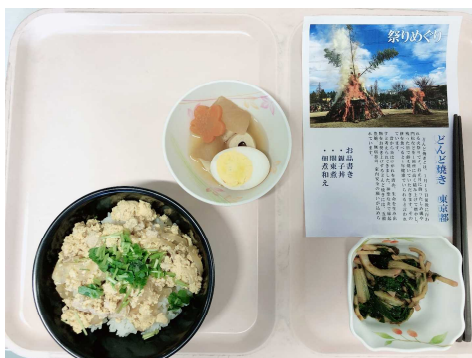
どんと焼き 東京都

コロナ禍で外出ができない状況が続いています。栄養科では、少しでも季節を感じてもらい、食事を楽しんでもらいたいと考えてイベント食などを提供しています。去年は、オリンピックイヤーだったこともあり、世界各国の郷土料理を毎月提供しました。今年は、祭りめぐりと題して、全国の祭りにちなんだ郷土料理を提供しています。